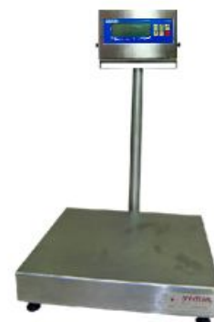
Opcional – coluna em pintura industrial para terminal de pesagem